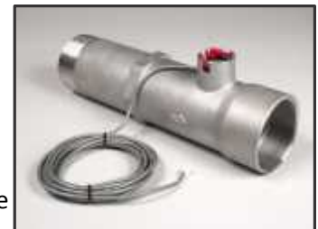
Option: compteur 3"