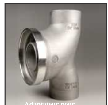
Adaptateur pour montage latéral